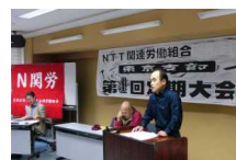
N 関労 第5回定期大会

今年の4月から導入された新評価制度は、現場の労働者の格差と競争を持ち込むもので、もう我慢できません。N 関労は50歳で退職再雇用という大量首切りを行いました。再雇用後は25%の賃金カットです。その後も合理化を推し進め職場の統廃合が行われてきました。N 関労がきちんと組合員のためにたたかわないのであれば、たたかう要求を持って新しい労働組合でたたかうしかありません。N 関労は、一人ひと