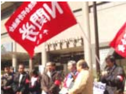
3月19日 NTT 持株会社前集会