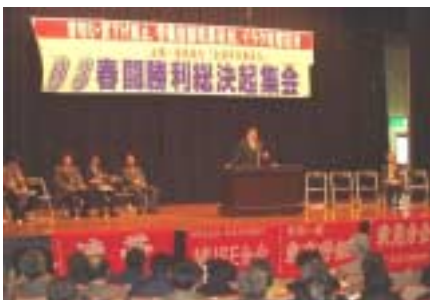
3月19日 春闘勝利総決起集会