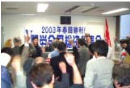
3月19日 N関労総決起集会