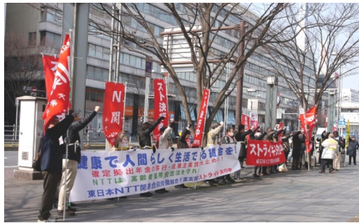
大幅賃上げ要求でスト=3月12日NTT千葉富士見ビル前

今年には多くの大企業が賃金のベースアップに応じた。ただ、ベア率は平均すると0.4%程度とみられている。今年には夏のボーナスが増えるなど前向きな要素はあるが、3%の物価上昇には賃金は追いつかなさそうだ(14.4.25日経新聞)。