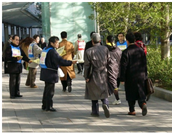
企業年金改悪に反対する会のデモ行進 (品川)