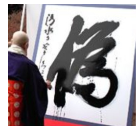
07年の世相を表した漢字の第1位は「偽り」

にたった計画は、2年もたたないうちに変更となりました。こうして、猫の目のように変わる組織見直しのたびに、引越した、やれ作業区分の変更だと現場は振り回されてきました。NTTは、こうして頻りにくりかえされる組織・業務見直しにつ