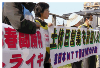
土休日営業撤回の横幕（4・3スト）

る」と話しています。また、とくに長距離通勤の仲間の多くは、1日の休みだけだと疲れが取れない、休んだ気がしない、と、訴えています。 今年度、東京センタの事業計画では「工事立会い、現場調査は行かなくてよい。10時～16時まで外販活動しろ。1日80件、月1000件」と訪問ノルマを上げた計画を出し