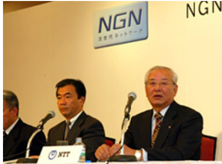
NTTの記者会見 (NGNトライアル)

中期ビジョンなし、あきれる現場 これで業績上げろとは虫がいい 3年前に埼玉県に移転した専用線受付センターは、また東京大手町に逆戻り。さらには、ME東京事業所は組織・業務見直しから、2年もたたないうちに今度は、NGNの社内系業務体制の名目で、そのとき分離した専用線業務とリンク(伝送)業務の統合を提案しています。たび重なる組織いじりに、現場は泣かされています。