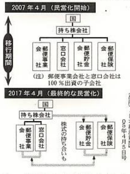
図 政府骨子案での郵政民営化のプロセス

「競争は経営者の論理、団結は労働者の論理」といわれるように、N関労は郵政労働者と連帯して郵政民営化に反対していきます。